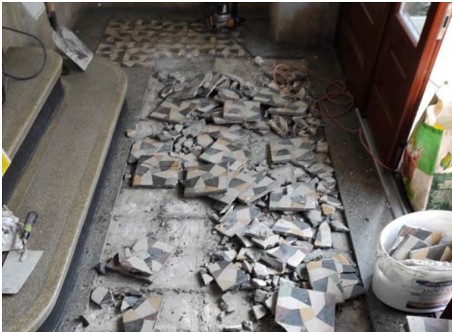
Legfrissebb felújítási hír: megkezdődött a bejáratok padlózatának kicserélése

Ahogy arról már hallhattatok, a gyülekezetünkben többféle munkacsoportot elindítottunk, amelyeknek az a célja, hogy a saját területükhöz kapcsolódó feladatokkal foglalkozzanak és az ennek során felmerülő kérdéseket, nagyobb döntést igénylő lépéseket az elöljáróság elé vigyék, de már előre előkészítve, hogy az elöljáróság ne kelljen a részletekkel foglalkozni, csak a lényeges dolgokkal. Valóban nem jó az elöljáróságig vakolat típusokról és cső átmérőkről dönteni.